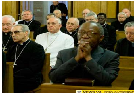
Il Papa agli esercizi spirituali di quaresima

Quanto bene fa l'esempio di un prete misericordioso! Di un prete che si avvicina