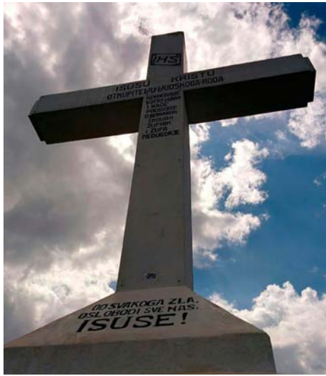
14 sett. - Festa Esaltazione della S. Croce

Questo è il piano di Dio per ciascuno di noi. Sia fatta la Tua volontà diciamo a Lui nel Padre nostro e questo solo dobbiamo dire e fare e vivere in ogni circostanza, in ogni azione della nostra vita e ci ritroveremo veri figli Suoi nel Figlio Suo Gesù! Niente di tutto ciò avverrà per magia, niente sarà gratuito né facile, ma tutto profumerà di Gesù, pur nella sofferenza e nel dolore come fu per Lui! Pace e gioia in Gesù e Maria!