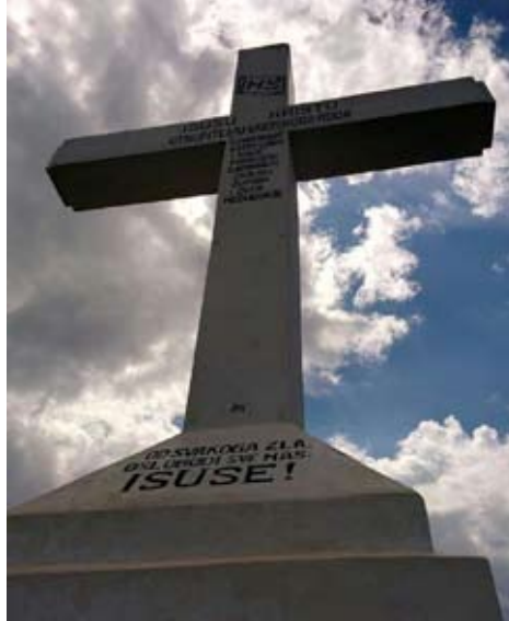
14 de septiembre Fiesta de la Exaltación de la Santa Cruz

Este es el plan de Dios para cada uno de nosotros. “Hágase tu voluntad”, le decimos en el Padrenuestro y esto es lo que debemos decir, hacer y vivir en cada circunstancia, en cada acción de nuestra vida, ¡Para así reconocernos como verdaderos hijos Suyos en Su Hijo Jesucristo! Nada de todo esto ocurrirá por arte de magia. Nada será gratuito ni fácil, pero todo llevará el perfume de Jesús, ¡Incluso en el dolor y en el sufrimiento, como el que El padeció! §