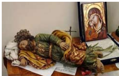
San Giuseppe Dormiente di Papa Francesco

3. Essere voci profetiche in mezzo alle nostre comunità. Giuseppe ha ascoltato la voce dell'Angelo e ha risposto alla chiamata di Dio... e con Maria è stato modello per il bambino Gesù mentre cresceva. Quando le famiglie mettono al mondo i bambini, li educano alla fede e ai sani valori e insegnano loro a contribuire al bene della società, essi diventano una benedizione per il mondo . L'amore di Dio diventa presente e attivo attraverso il modo con cui noi amiamo e attraverso le buone opere che compiamo. Così diffondiamo il Regno di Cristo nel mondo.