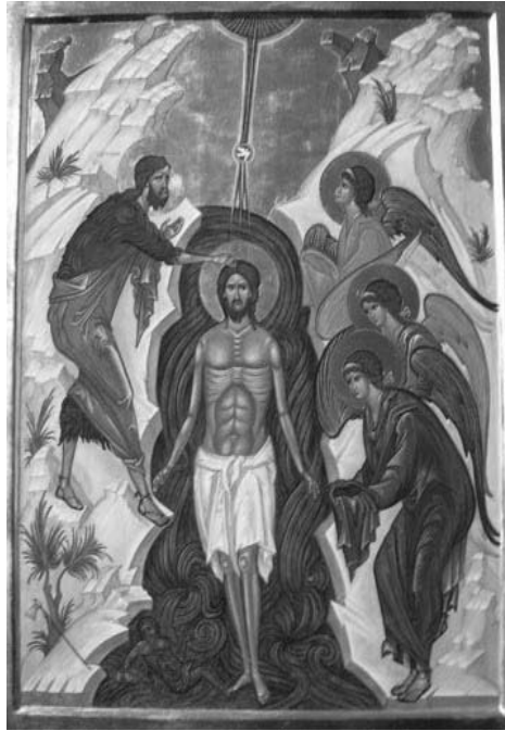
Messaggio a Mirjana 2 dicembre 2014

“Cari figli, tenetelo a mente, perché vi dico: l'amore trionferà! So che molti di voi stanno perdendo la speranza perché vedono attorno a sé sofferenza, dolore, gelosia e invidia ma io sono vostra Madre. Sono nel Regno, ma anche qui con voi. Mio Figlio mi manda nuovamente affinché vi aiuti; perciò non perdetevi la speranza, ma seguitemi, perché il trionfo del mio Cuore è nel nome di Dio.