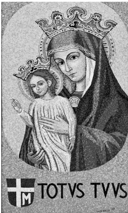
Mater Ecclesiae, St. Peter's Square, Vatican, desired by JPPI

Para el evento de Dios que se hace hombre, debemos prepararnos con todos los medios que la Iglesia pone a nuestra disposición. El primero de todos, el Sacramento de la Confesión y luego poniendo mayor atención a la Palabra, con el ayuno, la oración, la súplica y todo lo demás que nuestra Madre nos sugiere desde Medjugorje. Preparémonos con una renovada y mas fervorosa atención hacia las necesidades de nuestros hermanos que nos encontramos en nuestro quehacer diario o que tocan a nuestra puerta. Si de verdad Jesus comienza a vivir en nosotros, sentiremos su disgusto cada vez que pequemos por falta de amor al prójimo. En este tiempo estad lo mas cerca de mi Hijo a fin de que El os pueda guiar hacia su amor y hacia la vida eterna que todo corazón anhela . Este bellísimo auspicio de Maria traza nuestro camino en este Tiempo de Adviento, tiempo de acercamiento a Jesus, porque nuestro camino de asimilación a El no se encierra en el tiempo, en ningún tiempo.