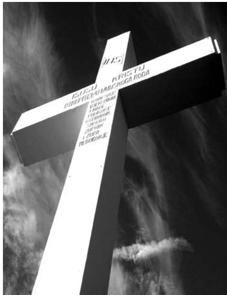
¡Te saludo, Oh Santa Cruz, que llevaste al Redentor!

No es la organización mundial la que salva al mundo, sino la Persona, el Hombre-Dios, que ya ha venido. Está en nosotros acogerle o rechazarle. Maria es Aquella que dona a Dios al mundo y Sus manos están todavía, y siempre, extendidas para entregar al hombre este don divino, humanamente impensable, lógicamente absurdo, y sin embargo único camino de salvación: ¡Dios en el hombre! Maria nos llama a que seamos Sus manos extendidas para satisfacer el anhelo de paz de este mundo inquieto . Acojamos el deseo de Maria para que Ella nos acerque a Su Corazón Inmaculado donde hallaremos refugio y paz , donde florece ese Sí temeroso pero fuerte, humilde pero consciente, capaz de llevar a Dios al hombre. Oremos para que Su Sí sea nuestro sí, para que en Su Corazón Inmaculado podamos ser asimilados a Jesus y podamos llevarLe al mundo, como manos extendidas de Maria. §