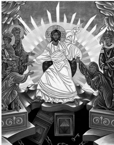
Io sono con voi tutti i giorni. Icona Comunità Cenacolo Medjugorje

Preghiera e conversione vanno insieme: non sono attività da espletare 'una tantum', né dipendono solo da noi, ma necessitano del nostro sì, della nostra accettazione. Sono regole di vita che si alimentano nei sacramenti e nell'ascolto della Parola: convertitevi e credete al Vangelo (Mc 1, 15b). La conversione si incarna nei nostri rapporti interpersonali, ispira le nostre quotidiane scelte e decisioni, illumina le nostre attese e speranze, consola le nostre sofferenze, sana le ferite. La conversione è crescita in Cristo ed al tempo stesso consente la Sua crescita in ciascuno di noi. Occorre svegliarsi dal sonno, dal torpore di morte che cova sotto un appariscente ed apparente efficientismo. È Pasqua, lasciamoci risorgere in Cristo; se non ora, quando? §