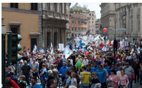
Roma 12.05.2013: ca. 40 mila persone alla Marcia