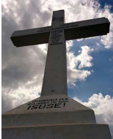
14 de septiembre Fiesta de la Exaltación de la Santa Cruz

Este es el plan de Dios para cada uno de nosotros. “Hágase tu voluntad”, le decimos en el Padrenuestro y esto es lo que debemos decir, hacer y vivir en cada circunstancia, en cada acción de nuestra vida, ¡Para así reconocernos como verdaderos hijos Suyos en Su Hijo Jesucristo! Nada de todo esto ocurrirá por arte de magia. Nada será gratuito ni fácil, pero todo llevará el perfume de Jesús, ¡Incluso en el dolor y en el sufrimiento, como el que El padeció! §